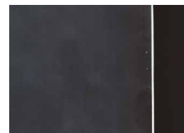
WIDOCZNA KOROZJA Szkło bazowe float, bez powłoki antykorozyjnej

TIMELESS to antykorozyjna, trwała powłoka, która zachowuje swoje właściwości przez wiele lat, nie spłukuje się podczas brania prysznica, czy czyszczenia kabiny. TIMELESS zapobiega tworzeniu się białego nalotu na powierzchni, który powstaje w procesie użytkowania kabiny. Utrzymanie w czystości szkła TIMELESS jest niezwykle łatwe i nie wymaga dodatkowych nakładów pracy.