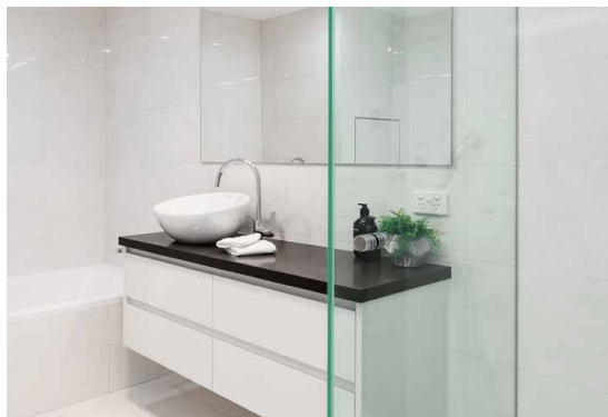
TIMELESS na szkło standardowym PLANICLEAR