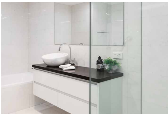
TIMELESS na szkło odżelazionym DIAMANT, wyraźnie jaśniejsza krawędź szkła