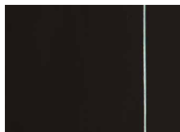
BRAK KOROZJI Szkło z powłoką antykorozyjną TIMELESS