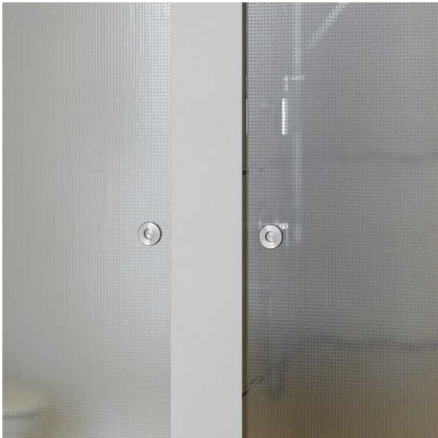
Szkło dekoracyjne DECORGLASS MASTERGLASS