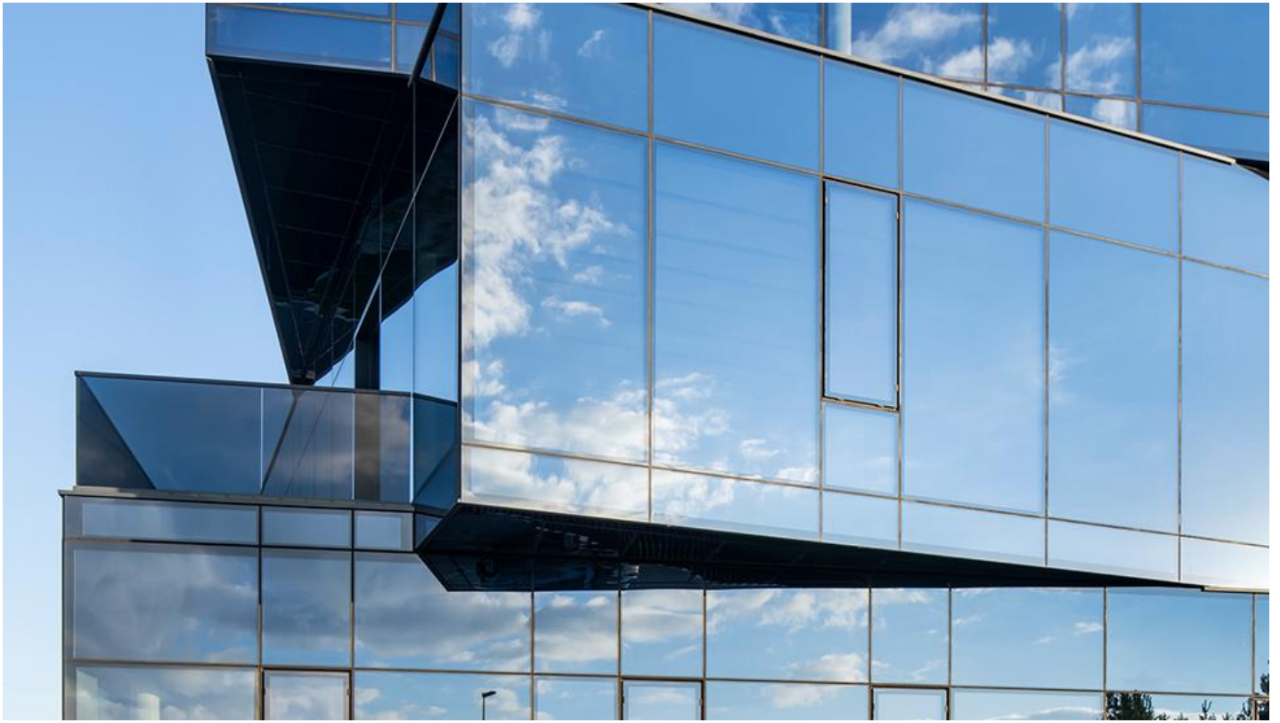
2_Nowa siedziba firmy Wutkowski