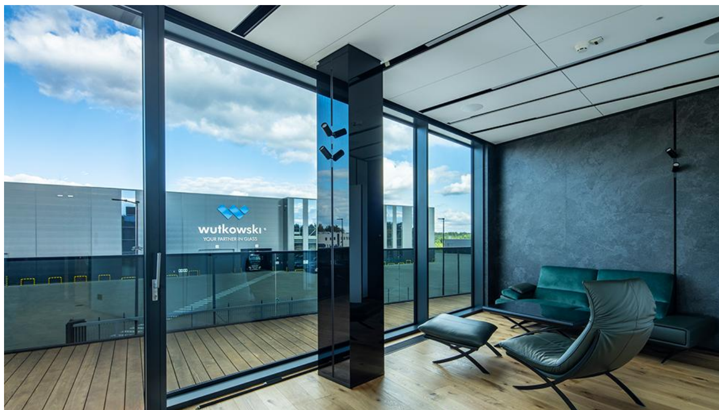
1_Nowa siedziba firmy Wutkowski