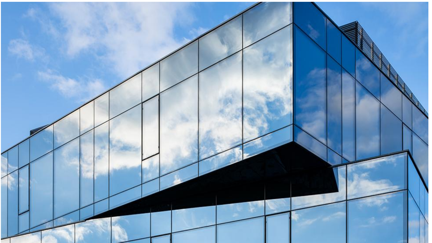
3_Nowa siedziba firmy Wutkowski